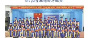
Sinh viên trong ngày Lễ tốt nghiệp