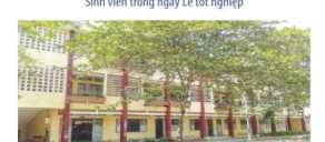
Khu Ký túc xá