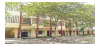
Khu ký túc xá